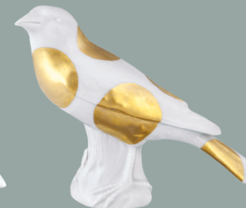
STIEGLITZ (GOLDFINCH), 9 CM MODELL (MODEL) JOHANN JOACHIM KÄNDLER, 1747 650009-77171-1