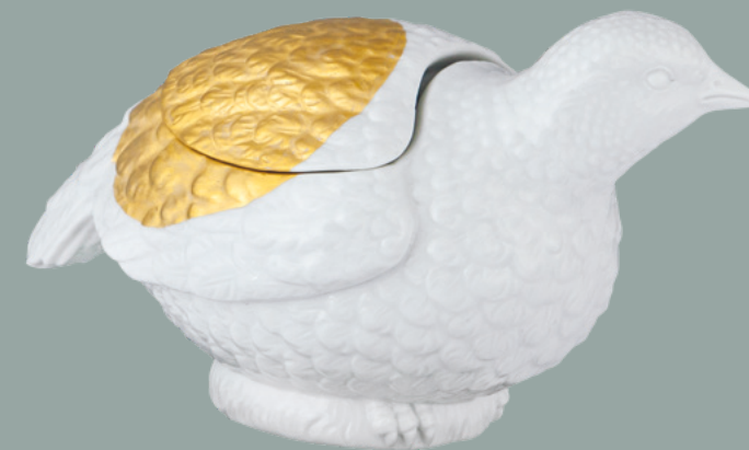
WACHTEL ALS DOSE (QUAIL BOX), 10,5 CM MODELL (MODEL) JOHANN JOACHIM KÄNDLER, 1744 650009-77102-1

These historical 18th-century bird figurines have been set in a modern context as part of the Meissen Atelier edition. The collection departs from a traditional naturalistic embellishment of the animals and their delicate plumage, instead, adorning them with luxuriant, amorphous gold discs. Ultra-gentle sand polishing is employed to impart the gold décor with its exquisite matt glow, while preserving the figurines' fine contours. The collection's contemporary look and feel makes it stand out in any setting.